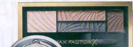
Palette con ombretti ultra pigmentati, Smokey Eye Drama Kit (11,55 euro). Excess Shimmer Eye Shadow (7,95 euro). Max Factor.

Quest'inverno li abbiamo utilizzati tantissimo per le nostre ragazze, dagli ombretti verde bottiglia per le rosse e ramate al blu notte per le brune, passando da melanzana, bordeaux e prugna scuro per i rossetti, fino a un arancio molto glam. Per dare modernità ai colori li